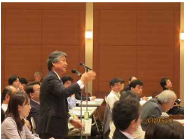
池ノ上理事長 自らも、意見を述べました