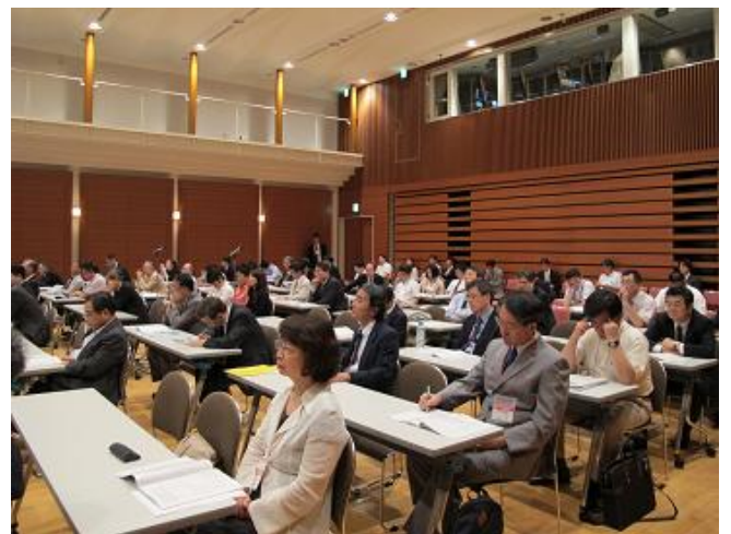
参加者は290名を越え、盛況でした