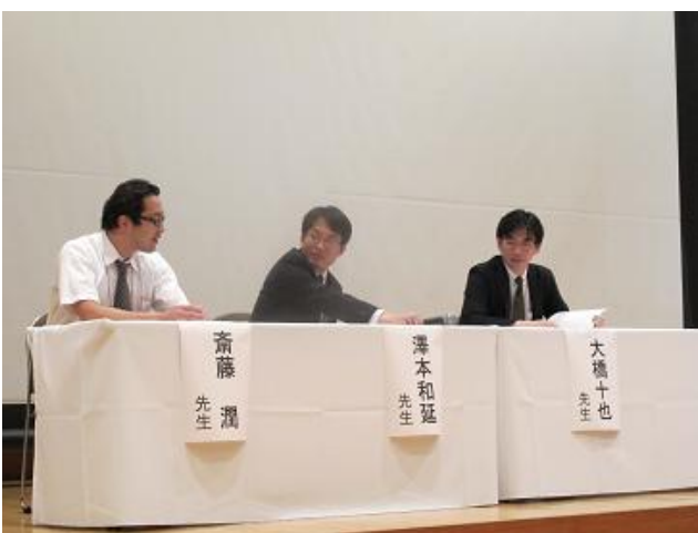
シンポジウムⅡ 格調高い議論が繰り広げられました