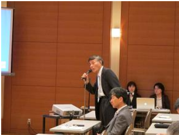
中畑先生からの鋭い質問が・・・