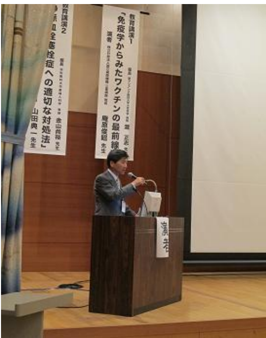
佐川会長による開会宣言