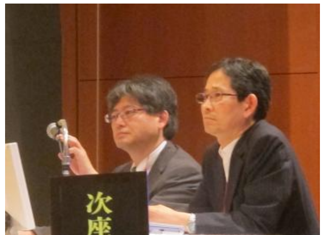
初の試み、公聴会を仕切るお二人（細野先生、板倉先生）