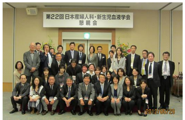
本学会を支えてくれた仲間たちです