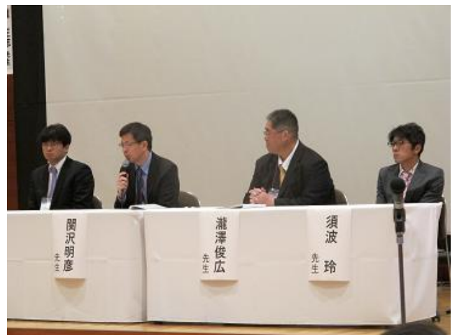
シンポジウムⅠ 新たな胎児診断法の到来を