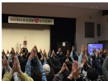
休憩 ～ヨガで頭すっきり～