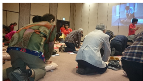
心臓マッサージ講習会